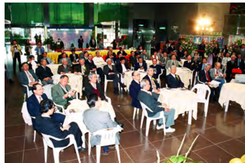
照片三 大會與會貴賓