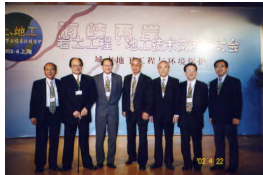
照片十八 兩岸(上海)大地工程學術交流