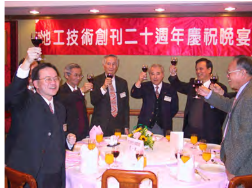
照片二十 地工技術創刊廿週年慶祝晚宴