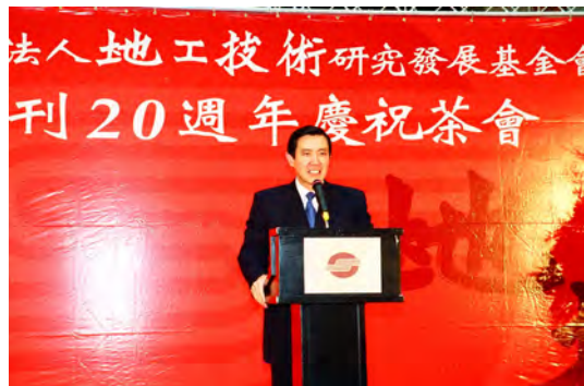
照片十二 台北市長馬英九先生致詞