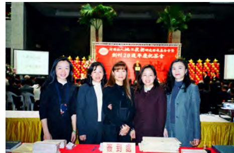
照片二 大會工作伙伴