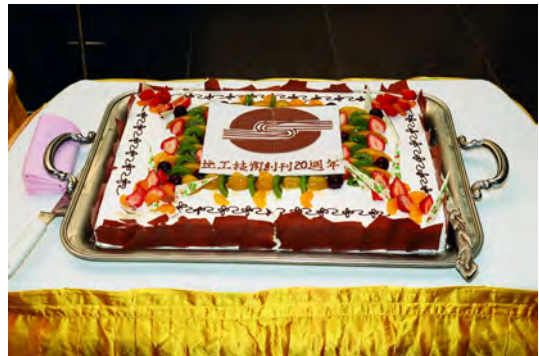
照片十四 地工技術創刊廿週年生日蛋糕