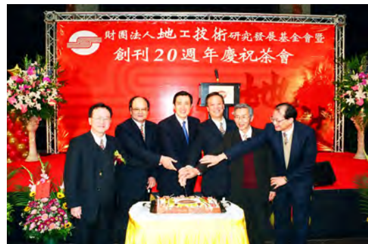
照片十五 馬市長與歷屆董事長共切慶生蛋糕