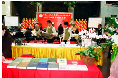
照片四 地工資料展示