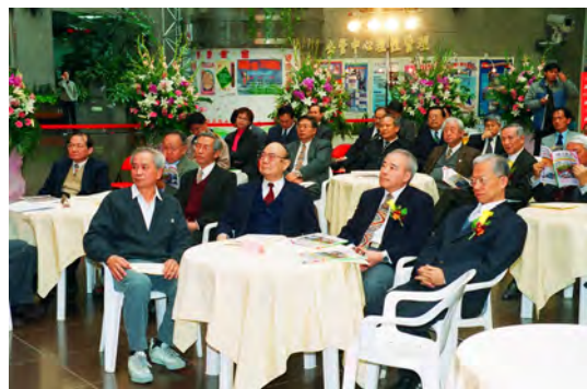
照片八 大會與會貴賓