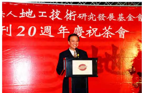
照片十六 創辦人歐晉德副市長主講廿週年回顧