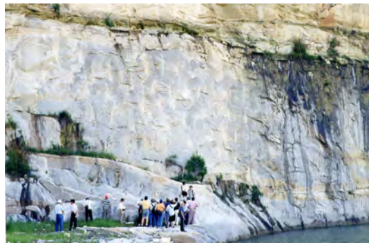
照片十九 金門地質之旅

訂戶、作者、專輯主編、廣告廠商、贊助人、贊助廠商、座談會/講習會主持人及參加者，以及相關公私營機關代表等，地工技術均因『昨日有您們的共同參與，才能有今日傲人的成績，未來更會秉持大家殷切的期許，作最大的努力』。地工技術創刊20週年慶祝活動，就在所有與會貴(尊)賓之共同惜緣隨緣與賀祝福聲中，以短暫的閉幕茶會聯誼，圓滿於當日下午六時結束。