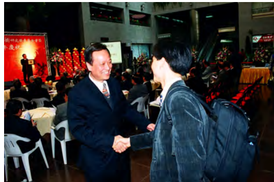
照片六 基金會創辦人歐副市長歡迎與會佳賓