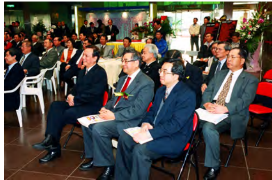
照片九 大會與會貴賓

本基金會創辦人歐副市長晉德博士緊接於馬市長致詞後，應基金會之盛情邀約而蒞大會上，以『理想、決心與行動』為主題，應用多媒體電腦簡報系統詳述地工技術雜誌的