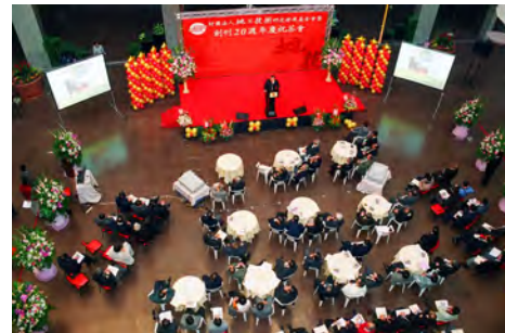
照片一 大會會場全景

隨著各界佳賓的陸續抵達會場和各媒體記者的關切參與，數位由工程界德高望重的前輩先進和平時僅能在電視媒體見其分身而難見其本尊的知名政府官員，亦均欣然應邀與會，其中較令人注目的有台北市市長馬英九先生、副市長歐晉德先生、國立中央大學校長劉全生博士、中華顧問工程公司董事長許瑞峰先生、中興工程科技研究發展基金會董事長程禹先生、前交通部高速鐵路工程局林崇一和廖慶隆二位局長、高雄市捷運局局長周禮良先生、交通部國道新建工程局局長鄭心隆先生、亞新工程顧問公司總經理莫苦楨先生、台灣大學名譽教授洪如江先生及基金