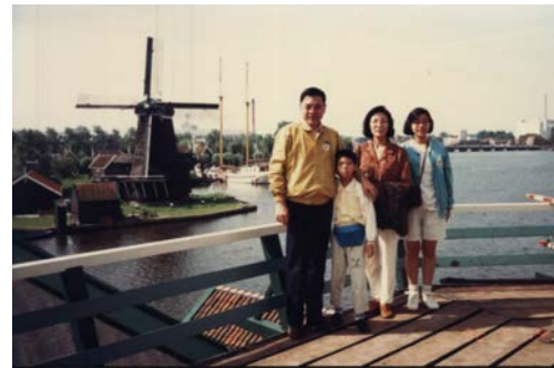
1992 年攝於阿姆斯特丹