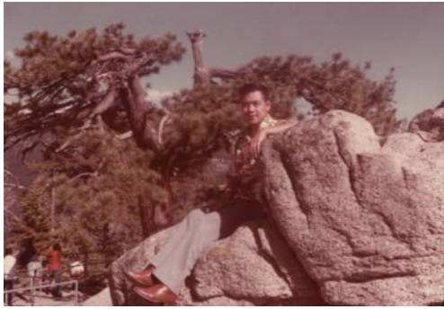
1977 年攝於好來塢山下