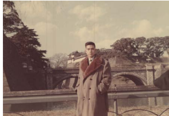
1965 年赴美途中經東京訪日皇宮

黃博士也分享他首次出國的經歷。1966 年聖誕節離開台北，香港玩了 2 天，東京玩了 2 天，12/31 晚上飛機降落西雅圖機場，旅途中印象最深刻的是把照相機給弄掉了，當時從西雅圖坐巴士到 Fargo，總共坐了 33 小時，坐得他胡裡胡塗的，記得中間有許多休息站，中途又換了車子，所以一不留神一台剛買的照相機就飛了。到了 Fargo 正好是 1967 年 1 月 1 日。到 1973 年第一次回國時已離家將近 7 年，頗覺愧對父母。當時飛機票很貴，單程就要 500 美金，合 2 萬台幣，相當於林務局工作一年的薪水，好像還沒有什麼來回票。這與後來他兒女去美國念大學，每年寒暑假都回家，真是不可同日而語。當然自己出錢和父母出錢畢竟不同。