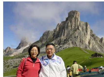
2002 年攝於義大利 Dolomite