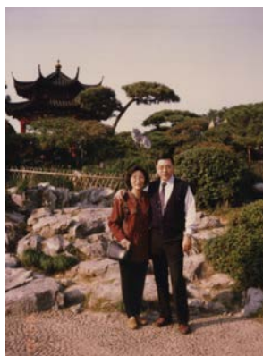
1994 年攝於北京頤和園