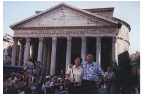
2002 年攝於羅馬萬神殿