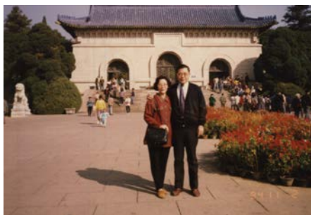
1994 年攝於南京中山陵