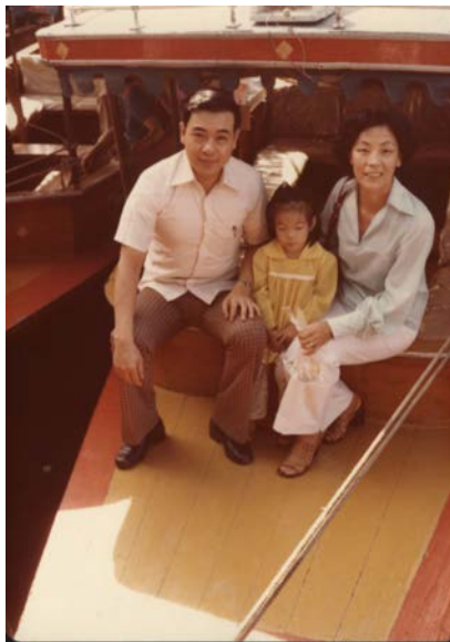
1981 年攝於曼谷水上市場