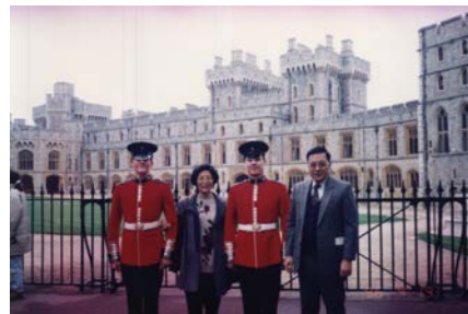
1996 年攝於倫敦溫莎堡