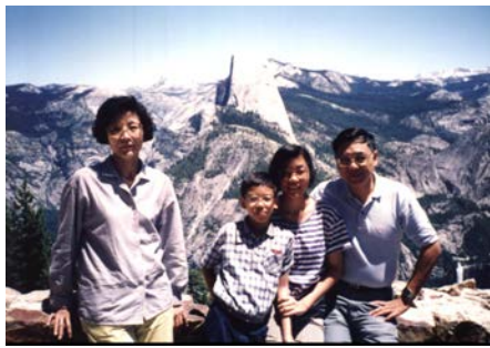
1993 年攝於加州優山美地