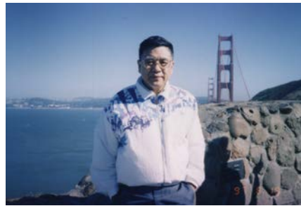
1997 年攝於舊金山金門大橋