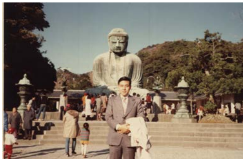
1980 年攝於日本鎌倉大佛