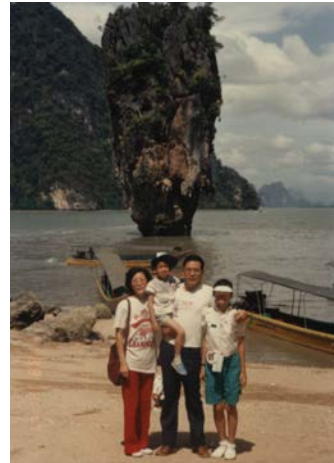
1988 年攝於 Bali 島