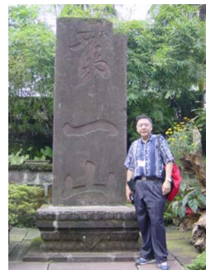
2002 年攝於四川峨嵋山