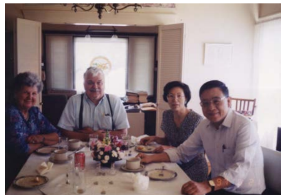
1997 年黃博士夫婦和 Lysmer 夫婦