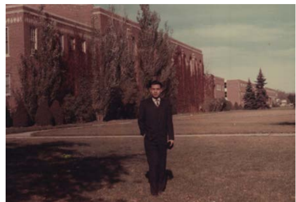
1970 年北達科達州立大學碩士生涯