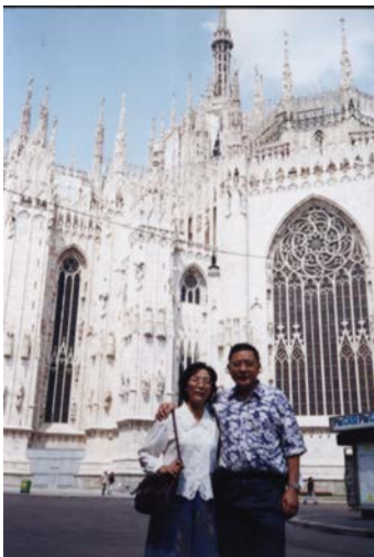
2002 年攝於米蘭大教堂