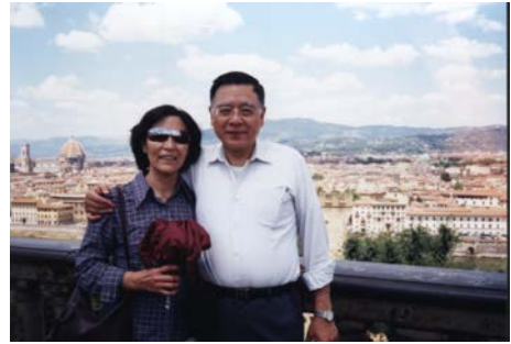
2002 年攝於義大利佛羅倫斯