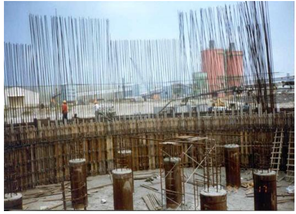
台中火力發電廠 3.4 號煙囪儀器量測(1993)