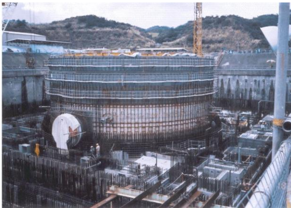
核能四廠監測系統工程(2004)