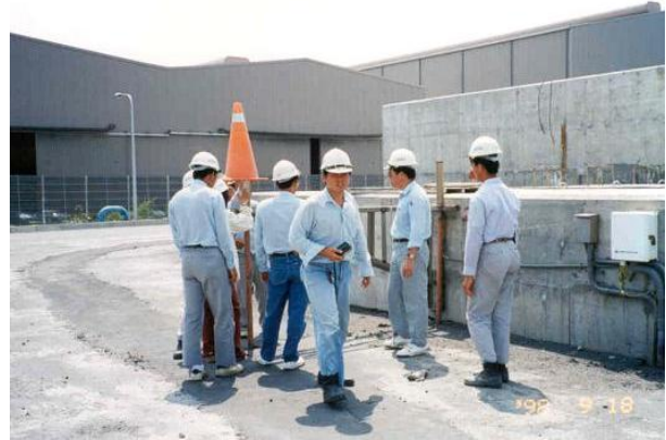
台塑麥寮六輕配水池測沉陷板自動化量測 (1998)