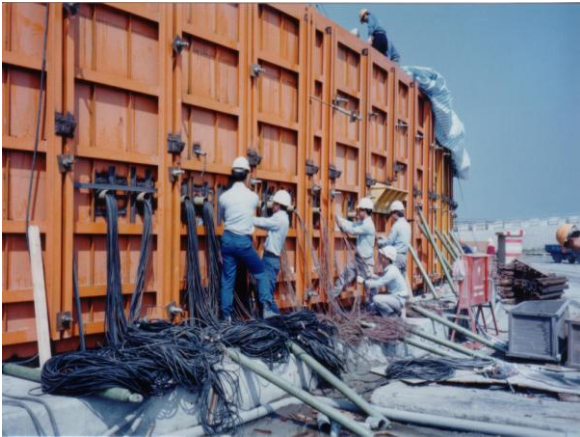
高雄 LNG 油槽安全監測儀器裝設(1989)