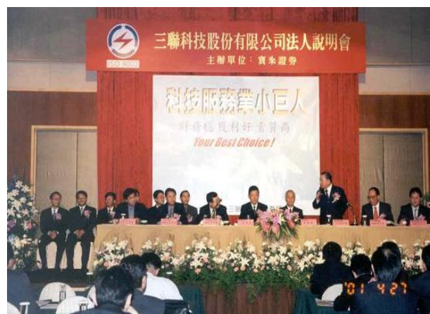
三聯科技股份有限公司法人說明會(2001)