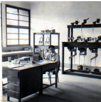
在台大土木系土壤力學實驗室 (民國50年代)

4. 舉辦座談會與定期的演講，邀請真正可以引領風潮的大師人物來臺演講（類似Rankine Lecture），促進知識的交流，並鼓舞士氣。