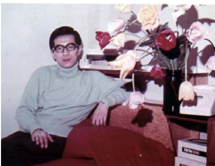
英國倫敦大學學生宿舍(民國57年)