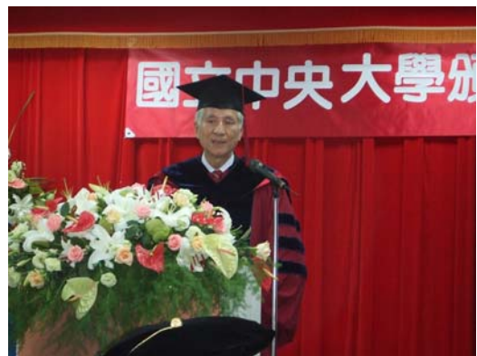
獲頒中央大學名譽工學博士學位