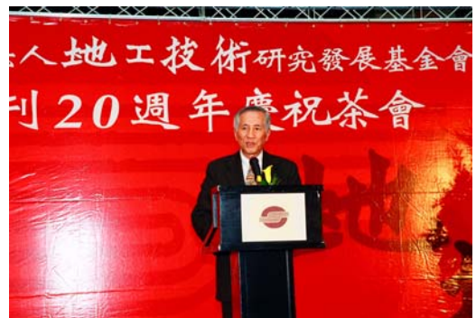
地工技術20週年會致詞