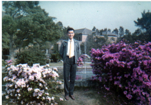
在台大校園(民國60年代)