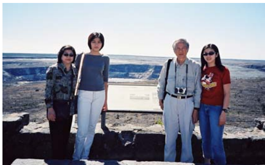
與家人在夏威夷大島火山口邊合影(民國90年)