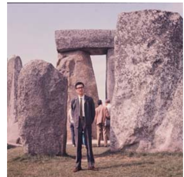
英國巨石陣(Stonehenge)前留影 (民國57年)