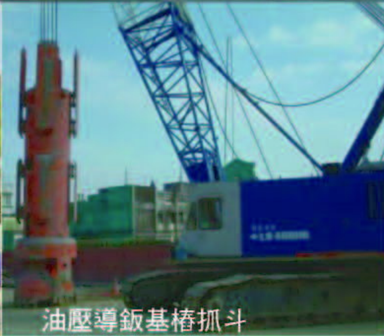
油壓導軌基樁抓斗