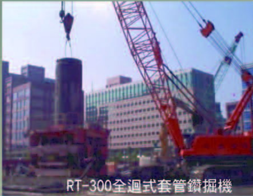
RT-300全迴式套管鑽掘機