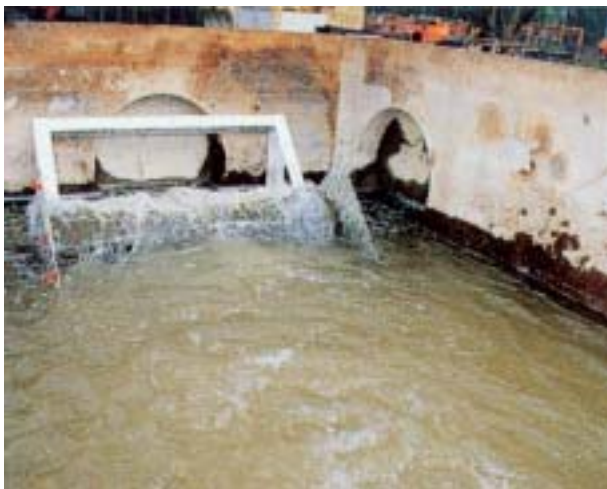
圖五 連續纖維補強土之流水侵蝕試驗