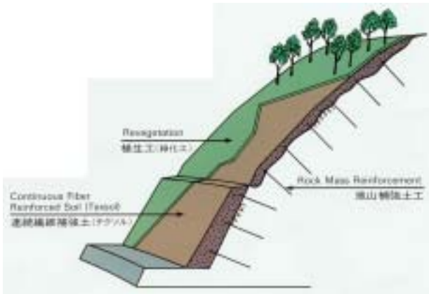
圖一 GEOFIBER工法綜合三種邊坡保護方法