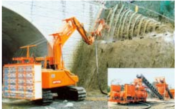
圖二 GEOFIBER工法之施工設備