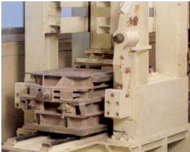
圖三 連續纖維補強土之大型剪力試驗儀器